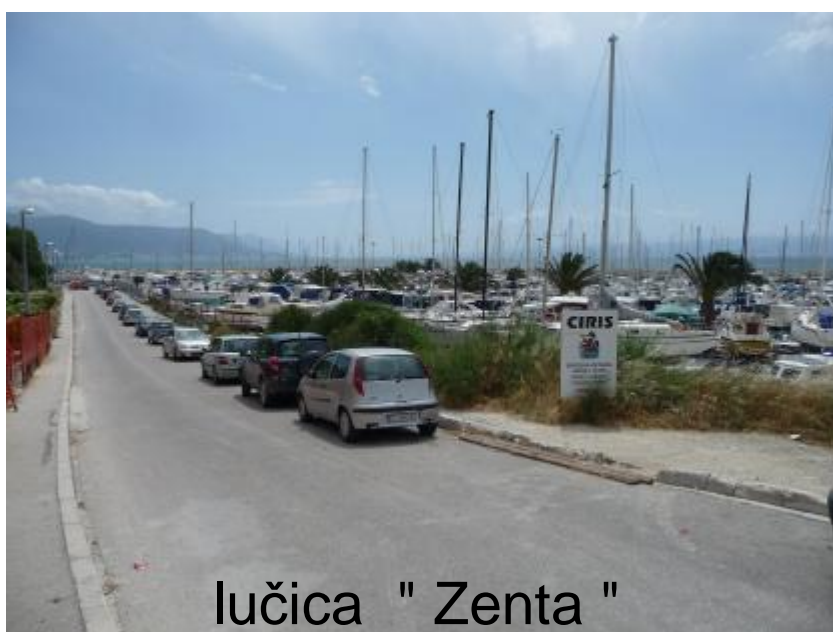
lučica " Zenta "

00385 / 98 706 689 - Eugen PRNJAK hovoří Chorvatsky a Anglicky